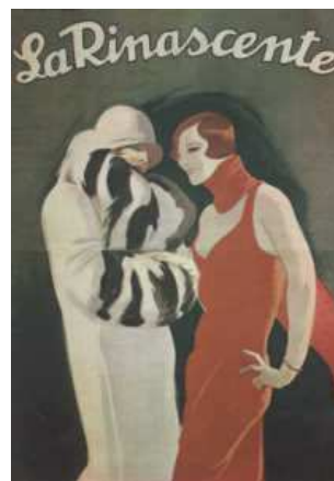
La donna-crisi del periodo fascista

S. Bellassai, Il nemico del cuore. La Nuova donna nell'immaginario maschile novecentesco , in «Storicamente», n. 1, 1 gennaio 2005, rivista di storia on line, www.storicamente.org