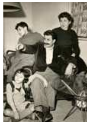
La casalinga italiana del boom economico