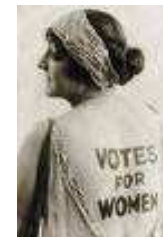
La tenacia delle donne nel sostenere il proprio diritto al voto.